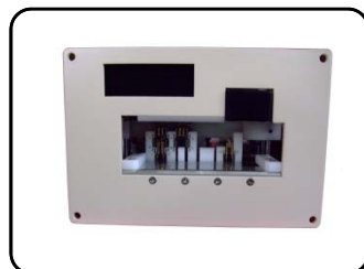
30 A単相2線ユニットタイプ注3