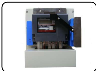
60A 単相/三相3線ボックスタイプ注2