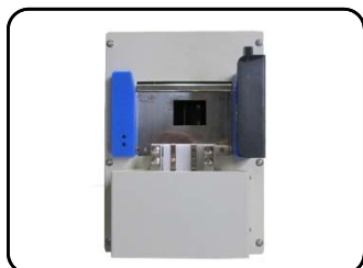
30A 単相2線ボックスタイプ注1